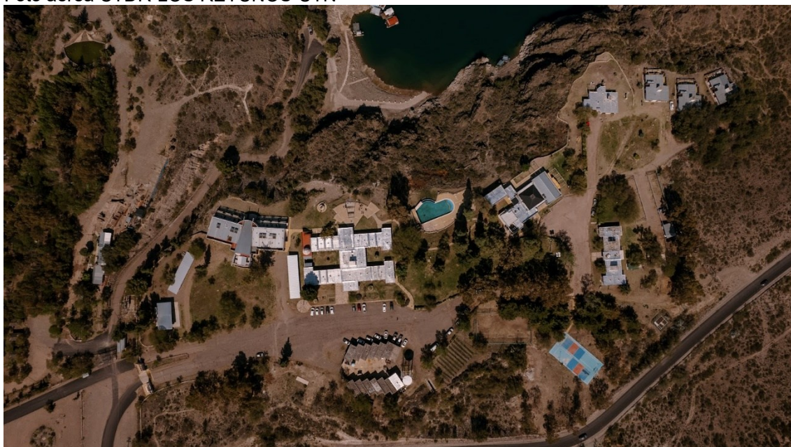
Foto aérea CTDR-LOS REYUNOS-UTN