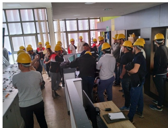
Visita Central Hidroeléctrica MAA-2023